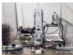
多関節ロボットの例