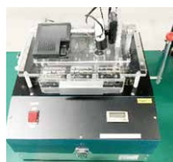
自動検査設備の例