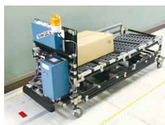
内製の自動搬送装置の例